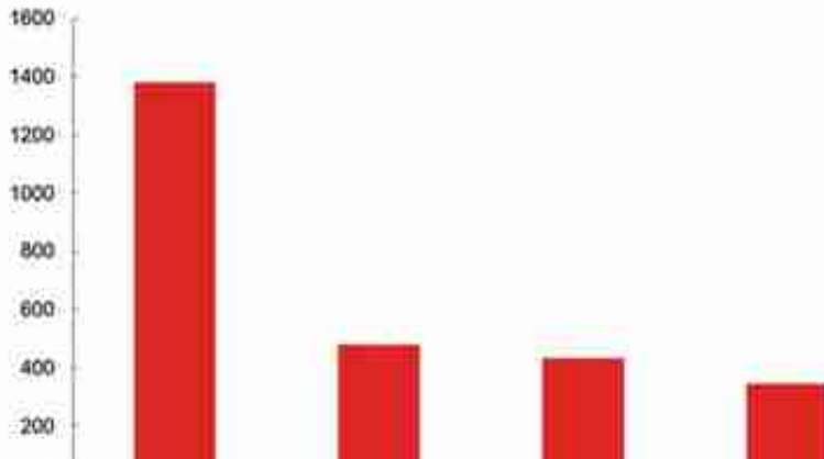
图 29: 截至 2022 年 7 月劳动合同纠纷对比