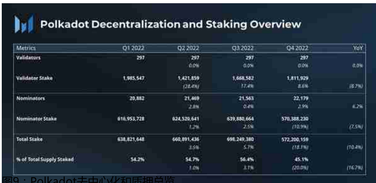
图9：Polkadot去中心化和质押总览