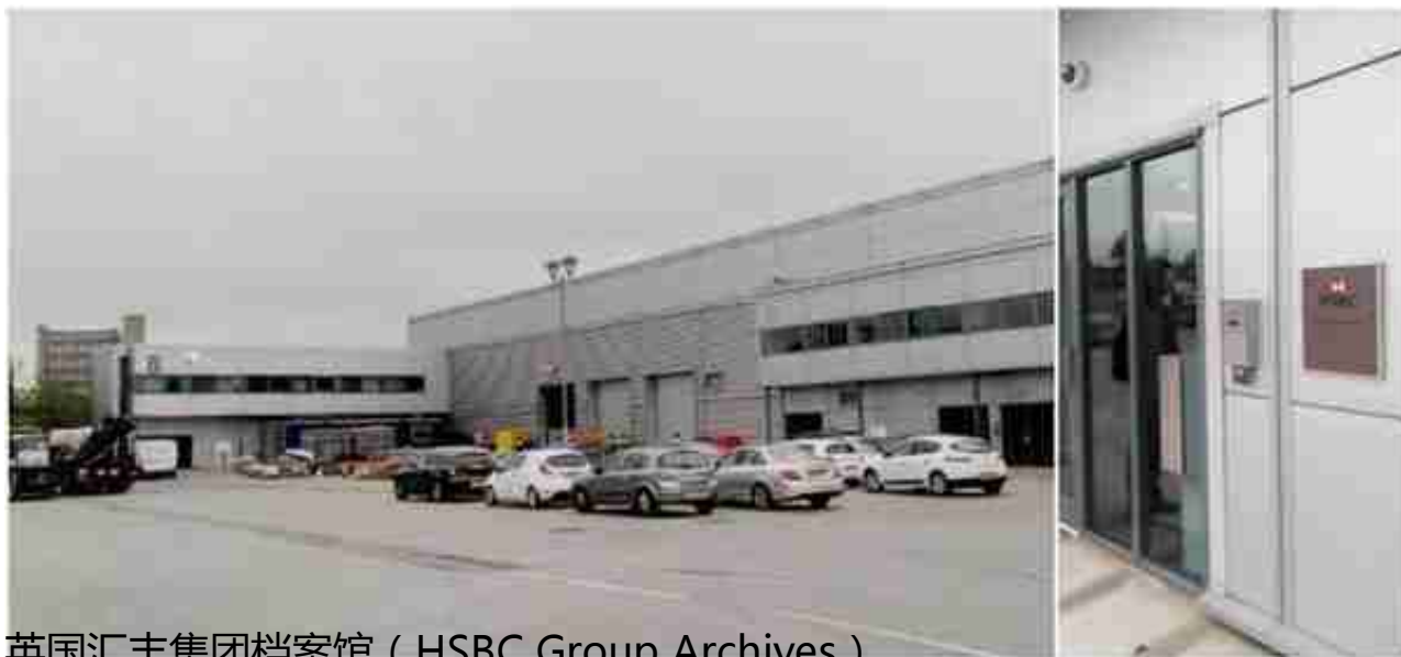
英国汇丰集团档案馆（HSBC Group Archives）

、财政部（T）档案、李滋罗斯个人档案（Leith-Ross Papers）等9种档案中汇丰银行涉华部分（1865—1949），进行系统收集，建立数据库，整理专题档案资料汇编，深入考察近代汇丰银行在华活动。