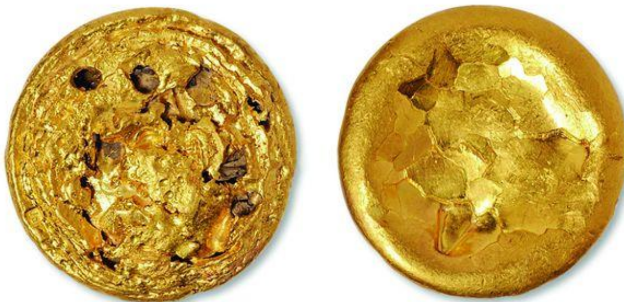
图1（上）：中国西汉海昏侯墓中出土的金饼。