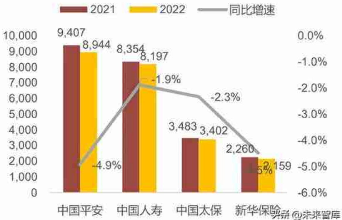
图8.上市保险公司剩余边际余额 (单位：亿元)

22年五家上市险企归母净利润合计减少19%，主要受资产端拖累。22年平安、国寿、太保、新华、人保分别实现归母净利润838亿元、321亿元、246亿元、98亿元、244亿元，分别同比-17.6%、-36.8%、-8.3%、-34.3%、+12.8%，主要受资产端拖累，人保正增长主要由财险业务盈利能力大幅改善带动。受净利润较大幅减少影响，22年平安、国寿、太保、新华ROE分别-2.9pct、-3.9pct、-1.3pct、-4.9pct至10.0%、7.0%、10.8%、9.3%，人保ROE提升0.8pct至11.1%。