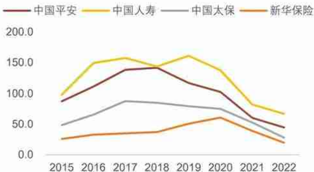
图39.上市保险公司代理人规模（单位：万人）