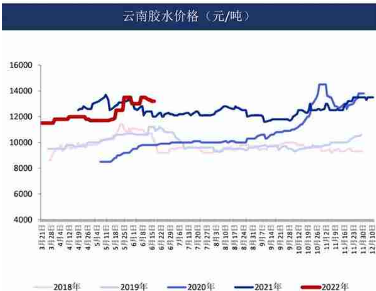
图1：泰国原料价格 图2：云南胶水价格

越南方面，整体来看本月降雨对越南影响相对较小，截止月尾原料产出增加，原料收购价格稳中窄跌。浓乳行情走跌，市场买盘减淡，加工厂生产利润偏低，对原料的采购情绪较上月明显降温，3L加工厂陆续有原料进厂，开工负荷提升维稳，产量有所增加，但工厂仍然存在亏损。