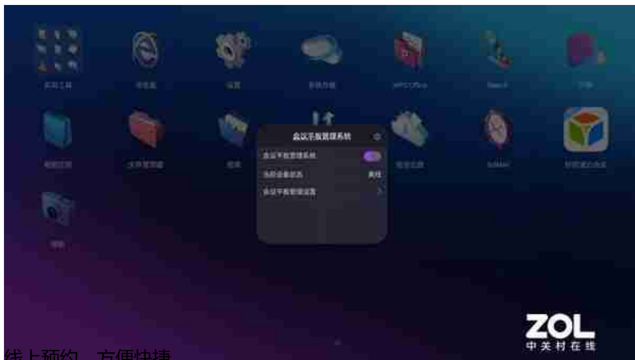
线上预约，方便快捷