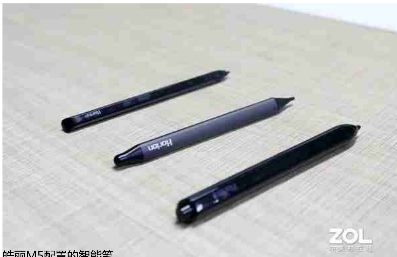
皓丽M5配置的智能笔

轻点智能笔后端即可开启批注模式，直接对PPT、图片上的内容进行修改批注，简单高效。长按后端则会打开聚光灯，突出显示重点内容，确保与会成员思路统一，让交流更有效率。