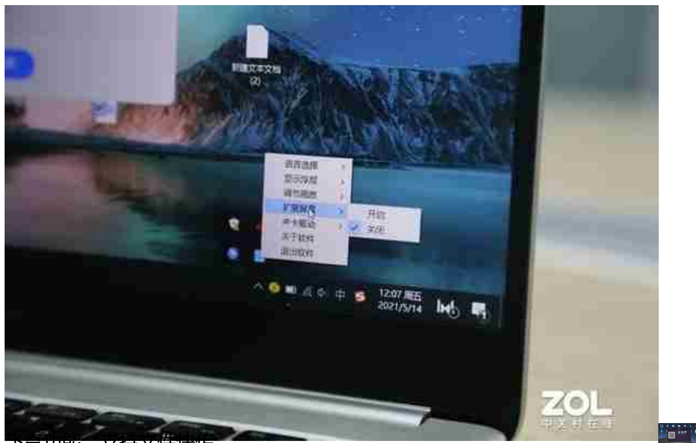
飞享功能，支持文件快传

皓丽M5会议平板还支持NFC投屏，支持NFC的安卓手机只要轻触NFC区域即可快速将画面展示到大屏幕上。本机同时新增了飞享功能，通过微信扫一扫即可将文件传输至会议平板，然后直接展示即可，以上种种这些或许就是对智能商务的完美诠释。