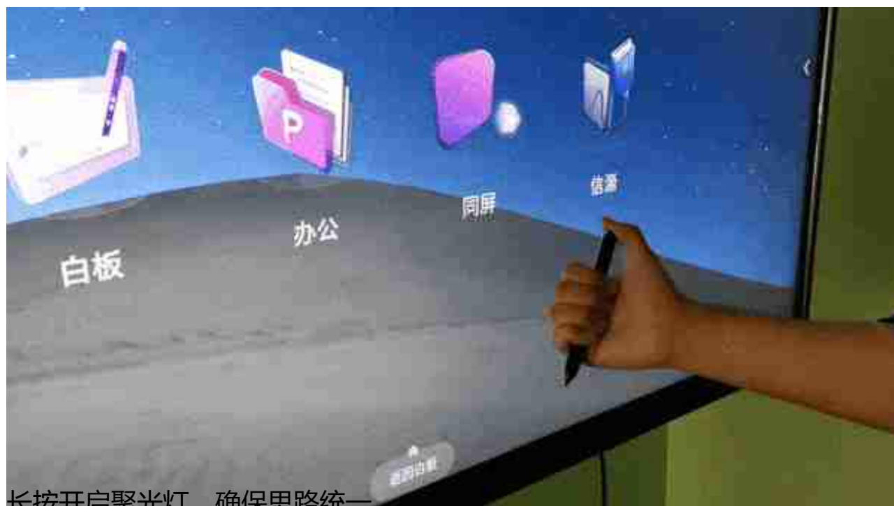
长按开启聚光灯，确保思路统一