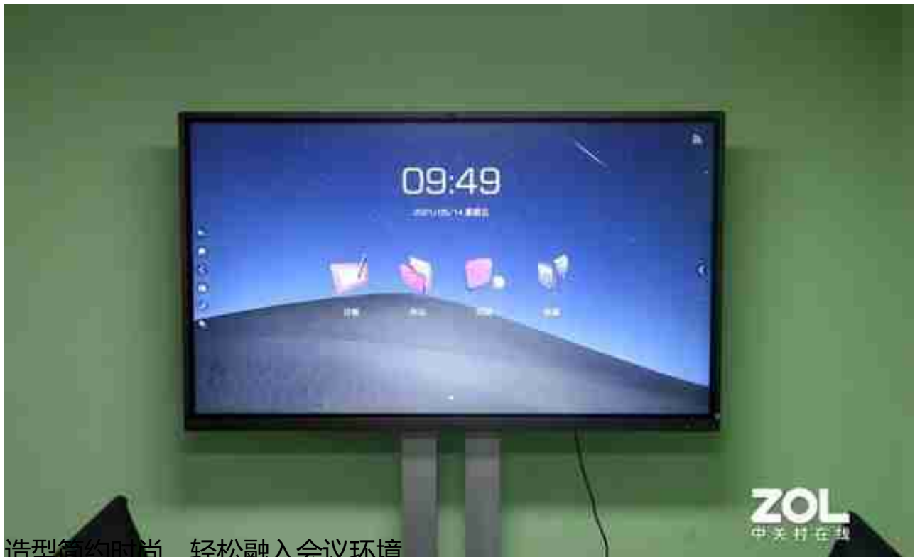
造型简约时尚，轻松融入会议环境