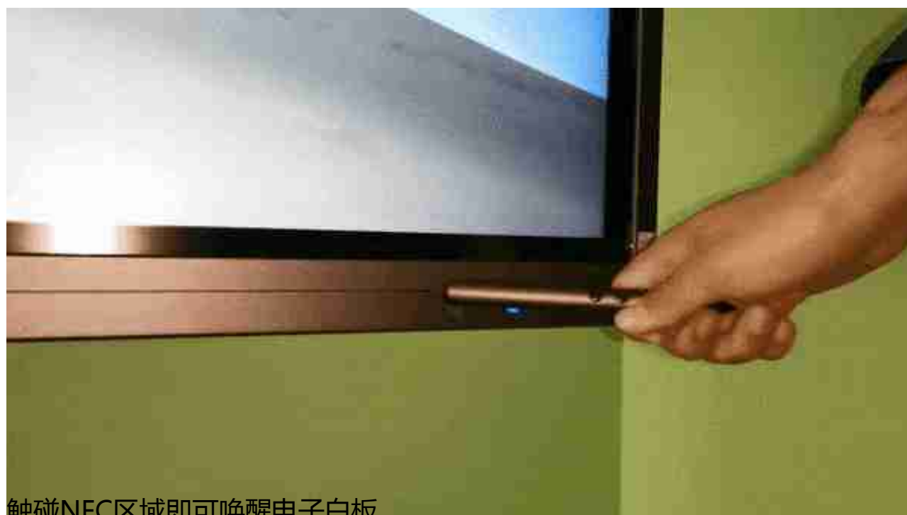
触碰NFC区域即可唤醒电子白板

纵观目前的会议平板市场，虽然几乎每款产品都会配备书写笔，但他们的功能还只是停留在传统的“书写”上。皓丽作为首家智能笔研发品牌，为用户带来了全新的体验，皓丽智能笔所搭载的智能飞鼠、语音操控以及聚光灯等功能可以显著提升协作效率，同时让会议方式更为多样化，在评测中表现足够惊艳。作为行业领导者，皓丽也再一次用创新推动了行业发展。