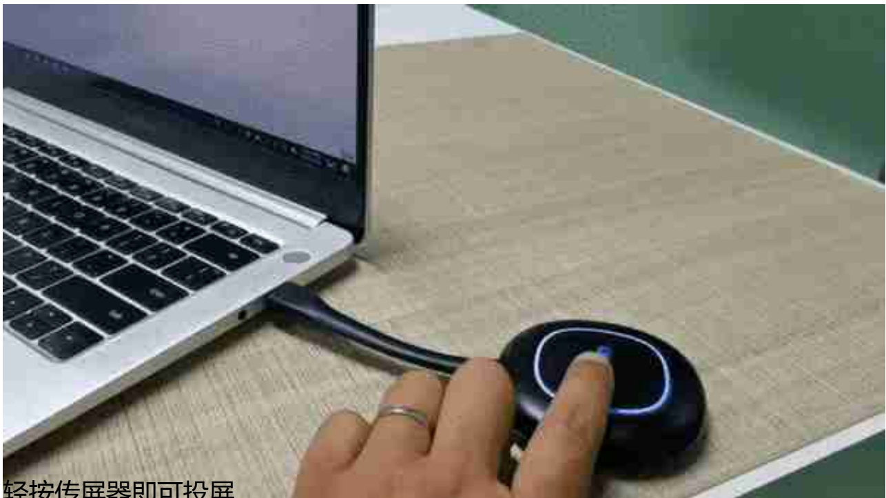
轻按传屏器即可投屏

首先为大家带来投屏功能的体验，皓丽M5会议平板支持同屏器同屏、DLNA同屏、NFC投屏等多种投屏方式，不同设备的画面都能快速展示到大屏幕上，从而提高会议效率。