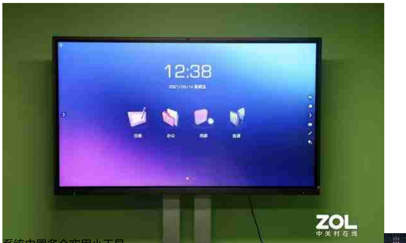
系统内置多个实用小工具