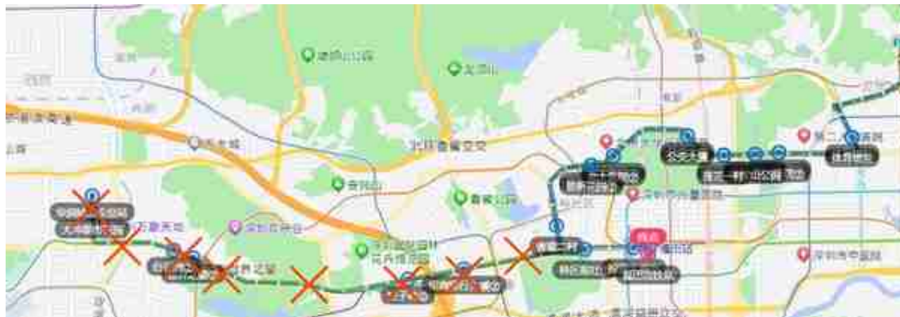
▲ E5线部分调整路段示意图